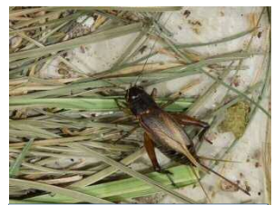
エンマコオロギのメス