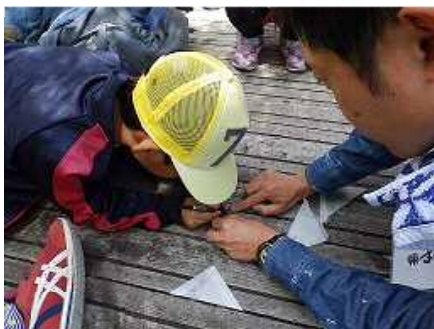
マーキングの様子

朝 8:30 に桶ヶ谷沼ビジターセンターを出発し、マイクロボス2台で「天竜の森」へ向かい、毎年行っているアキアカネの個体数調査を行いました。