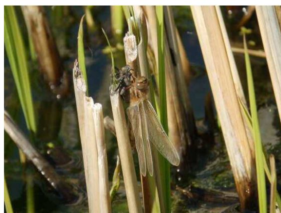
(3月20日 10:02 撮影)