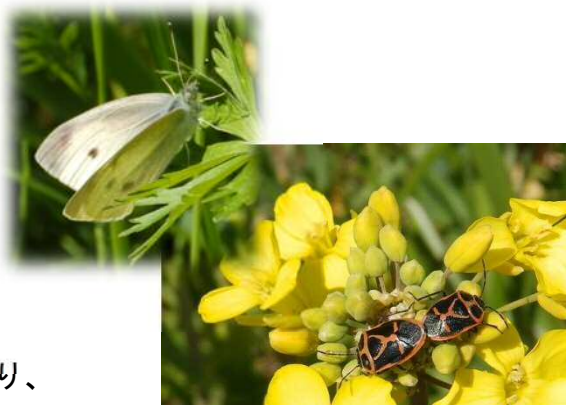
交尾中のナガメ(カメムシの仲間)

3月の初めには1、2頭だったモンシロチョウが何頭もヒラヒラと白い花びらが舞うように飛び交っています。