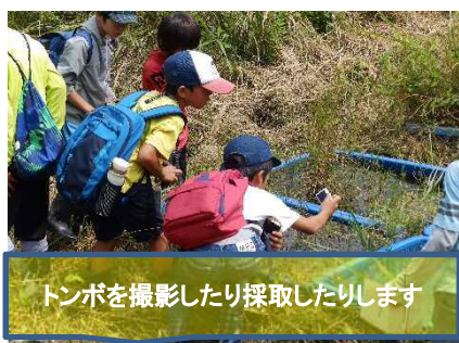
トンボを撮影したり採取したりします

今年度初のビジターセンター行事「夏のトンボ観察会」を7月26日(日)に行う予定でしたが、新型コロナウイルスの感染状況を考慮し、残念ながら今年度は中止としました。参加を楽しみにしていた皆様には大変申し訳ございませんでした。昨年の様子を写真で紹介いたします。来年を楽しみにお待ちください。