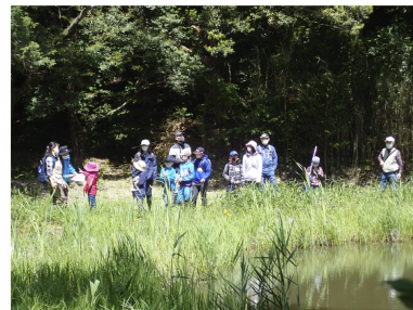
いりえ C(入江) グループ①