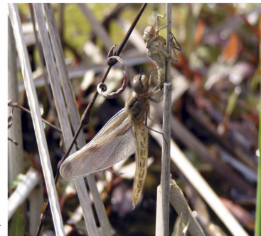
ウカ 羽化したて →