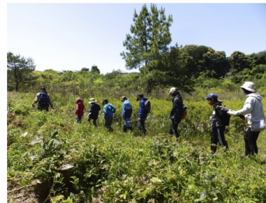
そうげん A(草原) グループ①