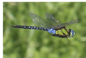
クロスジギンヤンマ