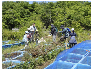
B(コンテナ) グループ②