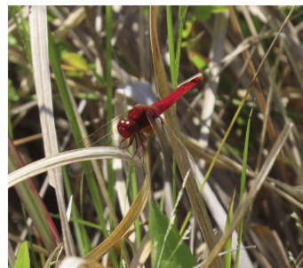
ショウジョウトンボ