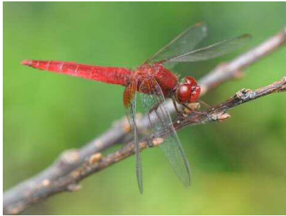
ショウジョウトンボ 成熟したオスは全身が真っ赤になります。5月から10月まで見られます。