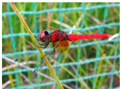
ハッチョウトンボ 体長は一円玉くらいの大変小さなトンボです。最近見られなくなりました。