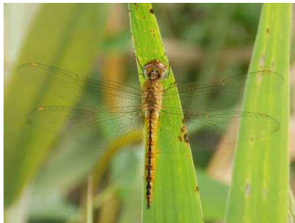
ウスバキトンボ 草原や運動場、ゴルフ場などで群れをなして飛んでいます。