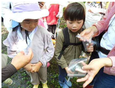
ビニール袋に入れて観察