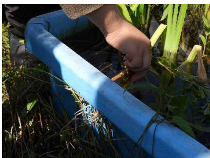
ショウジョウトンボのメスの尾を水につけると産卵しました