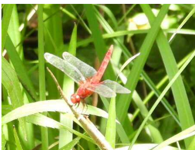
尾を立てて止まるのは暑さを防ぐため