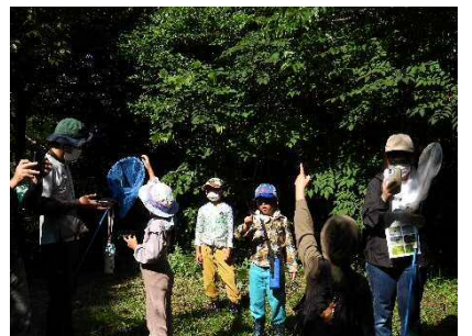
観察後に逃がしました