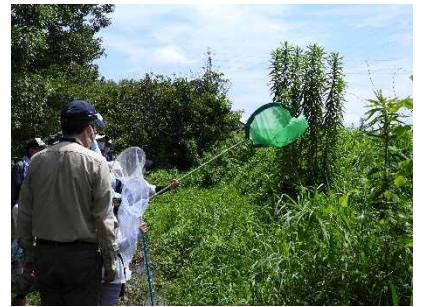
網でトンボを捕まえました