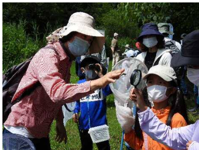
トンボの持ち方⇒指で翅をはさむ