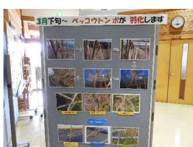
2022年のベッコウトンボ 羽化の様子