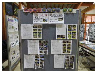
1年間のセンター行事の 活動内容を紹介