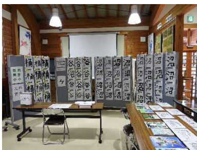
田原小、向笠小3年生に よる書写(桶・谷・沼)