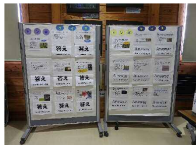
トンボについてよくわかる トンボクイズ