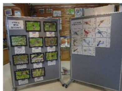
職員が描いたイラストと 実物の写真の比較