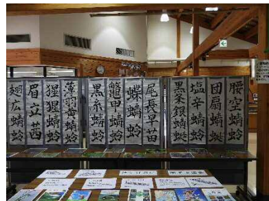
オツケーくんによる トンボの名前の書初め