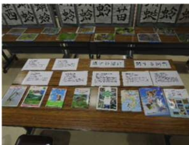
桶ヶ谷沼のことが書かれて いる本の紹介