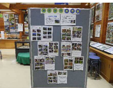
1年間のおげや自然塾 の活動内容を紹介